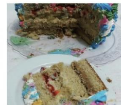
Imagens anteriores de divulgação da cliente